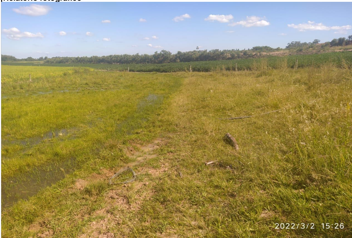
Foto 1 - Local onde será construído o microaçude (antes da realização da obra)

Data que foi obtida a imagem: 02/03/2022