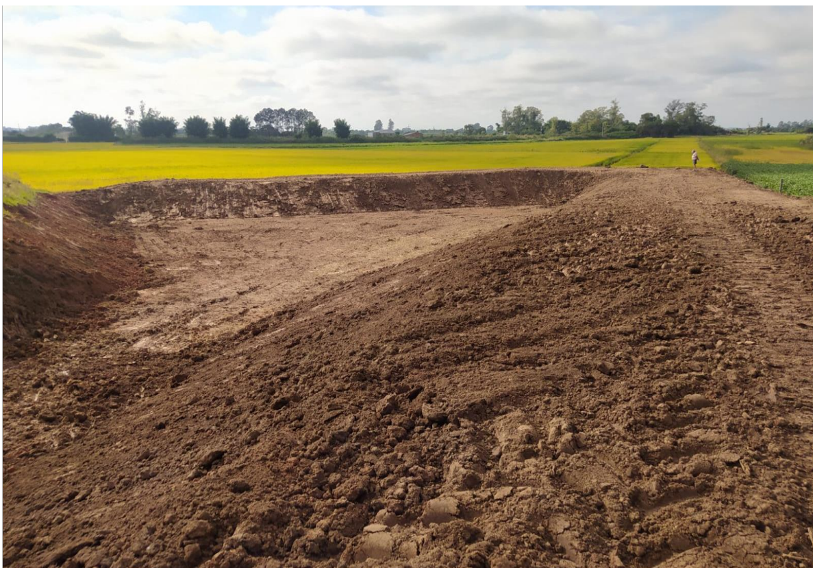
Foto 2 – Execução dos trabalhos de construção do microaçude (final da realização da obra)

Data que foi obtida a imagem: 02/03/2022