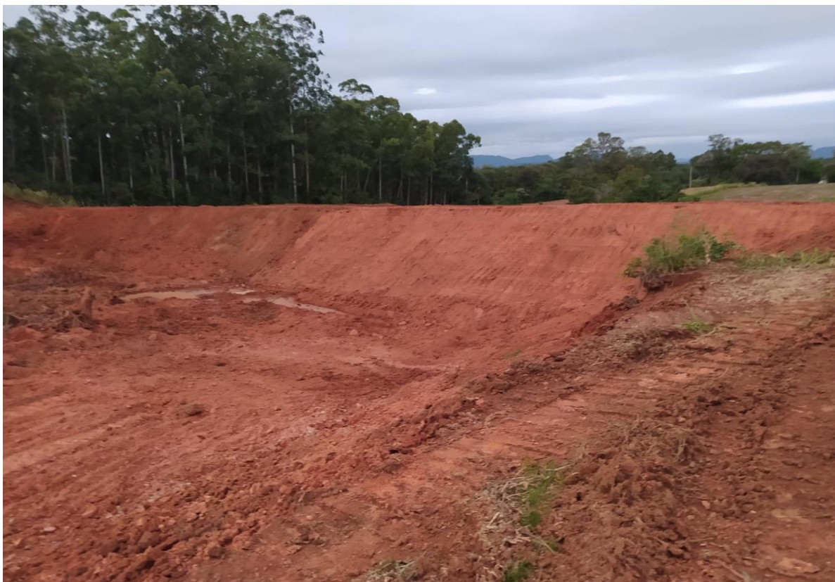
Foto 2 – Execução dos trabalhos de construção do microaçude (final da realização da obra)

Data que foi obtida a imagem: 03/03/2022