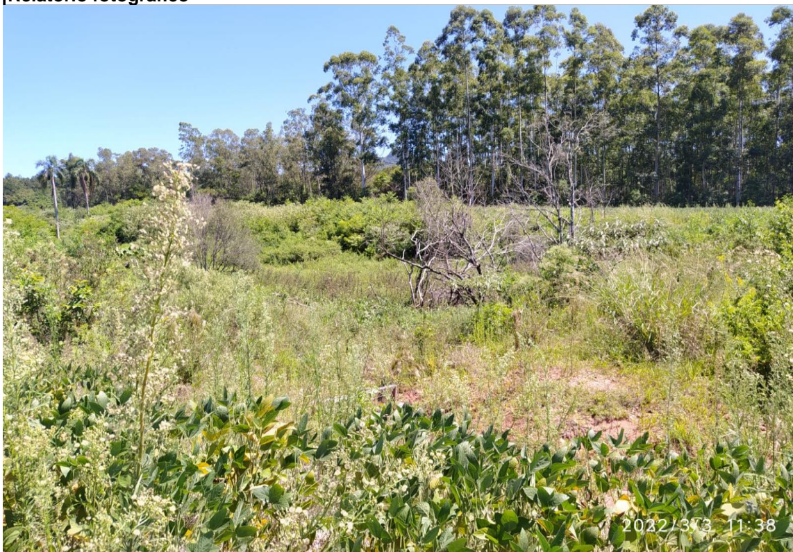
Foto 1 - Local onde será construído o microaçude (antes da realização da obra)

Data que foi obtida a imagem: 03/03/2022