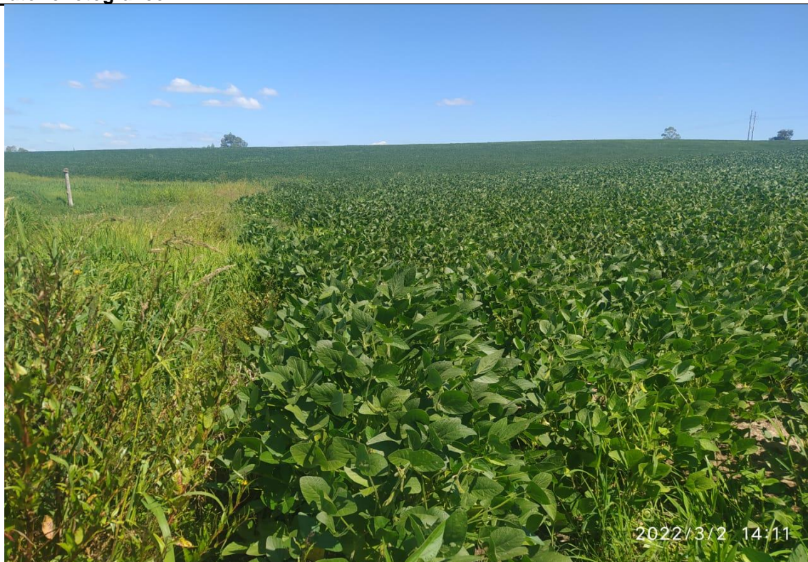
Foto 1 - Local onde será construído o microaçude (antes da realização da obra)

Data que foi obtida a imagem: 02/03/2022