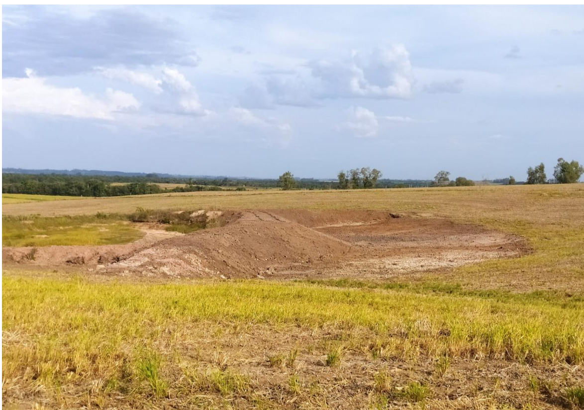
Foto 2 – Execução dos trabalhos de construção do microaçude (final da realização da obra)

Data que foi obtida a imagem: 02/03/2022